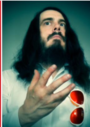
Jonathan Meese

17.02.2017, 17.00 Uhr art KARLSRUHE-Preis