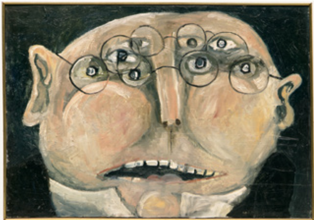
Halle1 | Tomi Ungerer: „L'Homme aux Lunettes“ („Der Mann mit Brille“), 1963, Öl auf Leinwand, 64 x 91 cm, Sammlung Würth, Inv. 6098